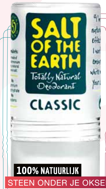
100% NATUURLIJK STEEN ONDER JE OKSEL

4711 was de allereerste eau de cologne en zelfs Napoleon was een grote fan! Onlangs maakte de gekende geur een opmerkelijke comeback. Na meer dan tweehonderd jaar komt er een update van het gekende geurwater uit Keulen. Het originele parfum werd verrijkt met lychee, zwarte bessen en de citrusvrucht yuzu. De deo uit het bijhorende gamma is intens fris en zorgt de hele dag lang voor een uitzonderlijk aangenaam gevoel. Deodorant 4711 NOUVEAU COLOGNE €10,95