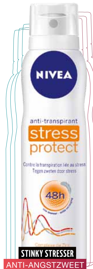
STINKY STRESSER ANTI-ANGSTZWEET

Stinken mag voortaan zonder verpinken. Zweetoksels zijn geen zwakte, maar een slim evolutionair verdedigingsmechanisme. Dat beweerde de Britse archeoloog Louis Leaky tenminste. Roofdieren zouden onze voorvaders links hebben laten liggen wegens 'te stinkend om lekker te kunnen zijn'. Dank voor de stank!