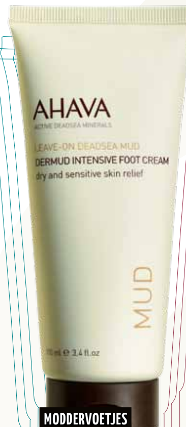
MODDERVOETJES DODE ZEE-MINERALEN

AHAVA is het ultieme Dode Zee-verzorgingsmerk. In tegenstelling tot wat de naam doet vermoeden, bevat de Dode Zee tal van levensverbeterende ingrediënten met bewezen herstellende eigenschappen. Deze crème bevat minerale modderextracten die ruwe plekken, roodheid en barsten heel snel herstellen.