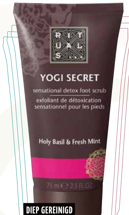
DIEP GEREINIGD MET AYURVEDA

Volgens de ayurvedische traditie begint het reinigen van je lichaam bij je voeten. Door je voeten te scrubben voelt je lichaam zich geaard en komt je geest in balans. Deze scrub versnelt het zuiveringsproces van de huid zodat je voeten zacht én intens gereinigd worden. Bevat eeuwenoude ingrediënten als heilig basilicum en munt.