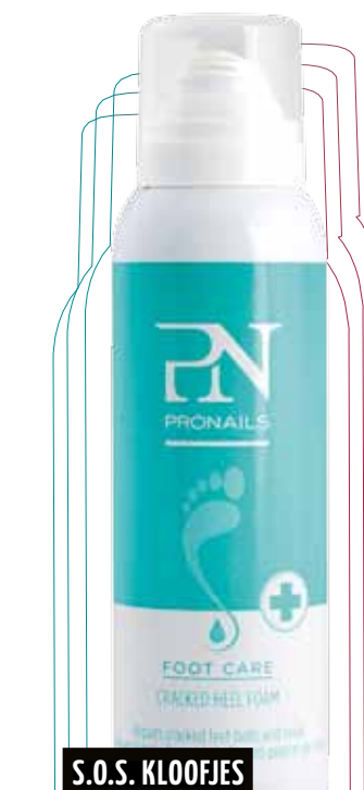
S.O.S. KLOOFJES ZACHTE ZOMERZOLEN