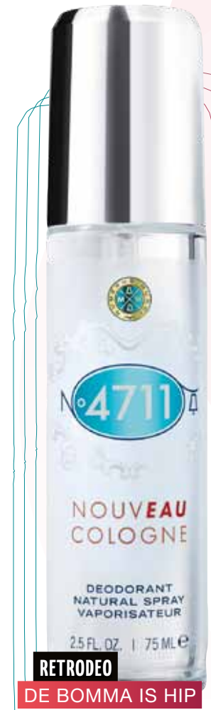
RETRODEO DE BOMMA IS HIP

Deze deo focust zich heel specifiek op 'emotionele' transpiratie. Een vorm van transpiratie die niets met hitte of lichamelijke inspanningen te maken maar alles met stresssituaties. Werd met succes getest in echte stress-situaties zoals een sollicitatiegesprek en een toespraak in het openbaar. Vermindert de transpiratie, gaat geurtjes tegen en draagt zorg voor de gevoelige oksel huid. Stress Protect NIVEA €3,29